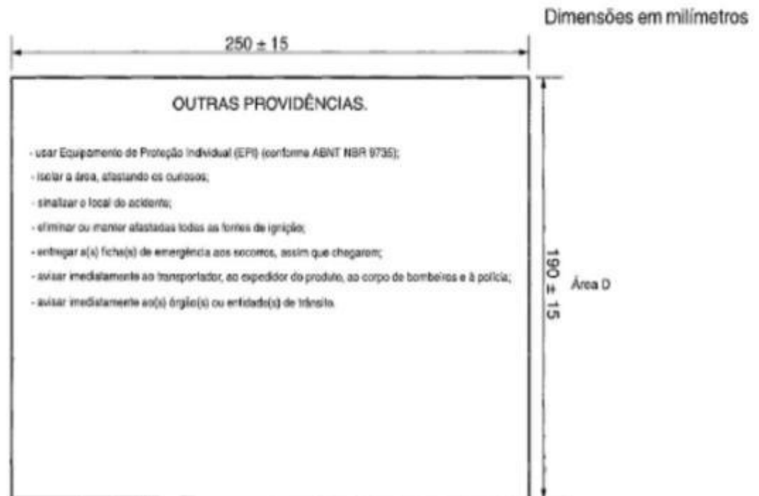
Figura B.2 – Área D do envelope (verso)